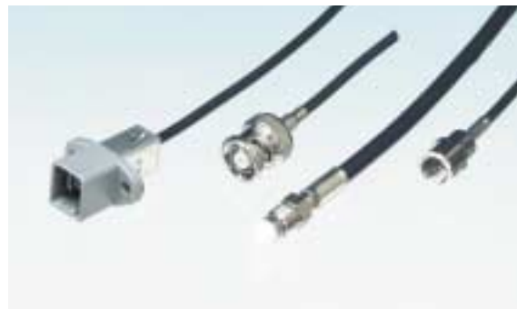
その他のコネクタ