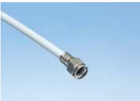
ピン無し防水丸カシメコネクタ