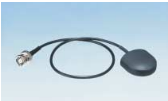
GPS アンテナ (使用例)