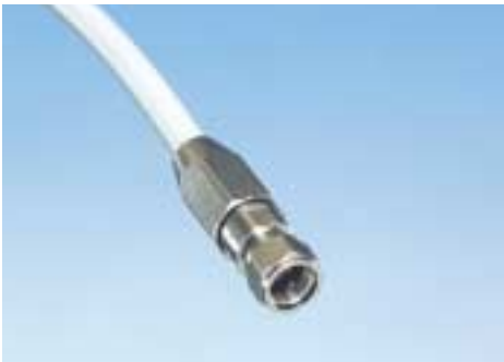
完全防水型コネクタ