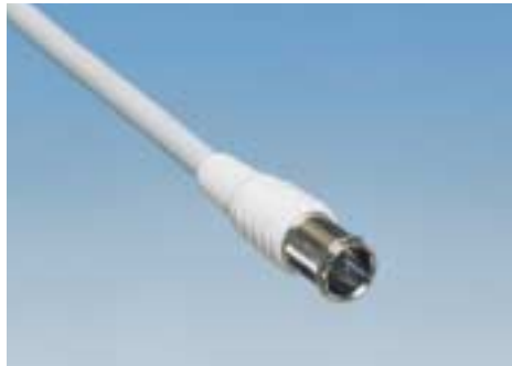
ストレートワンタッチコネクタ