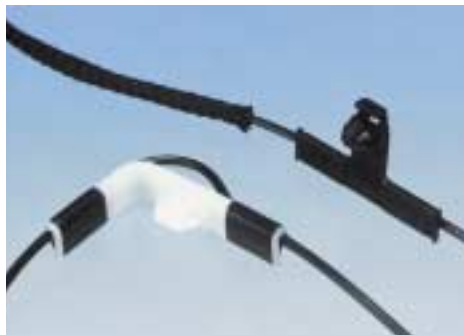
クリップ取付ハ - ネス