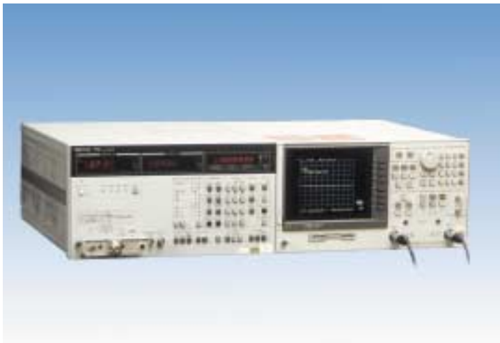
ネットワークアナライザ 8753D (ヒュレットパッカード製) インピーダンスアナライザ 4192A (ヒュレットパッカード製)