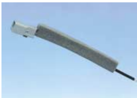
ソフトテープ取付ハ - ネス

各種コネクタ ASSY へのハーネス行います。 ご要望に応じた仕様により、受注生産致します。