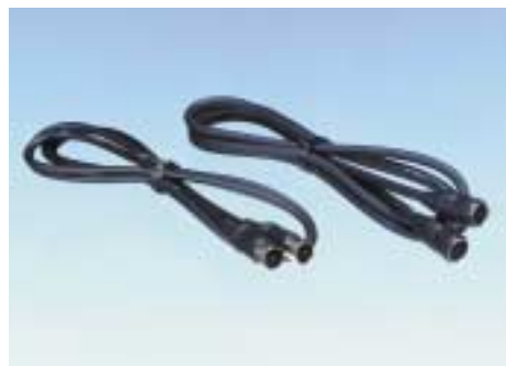
RFコード、S端子コネクタ