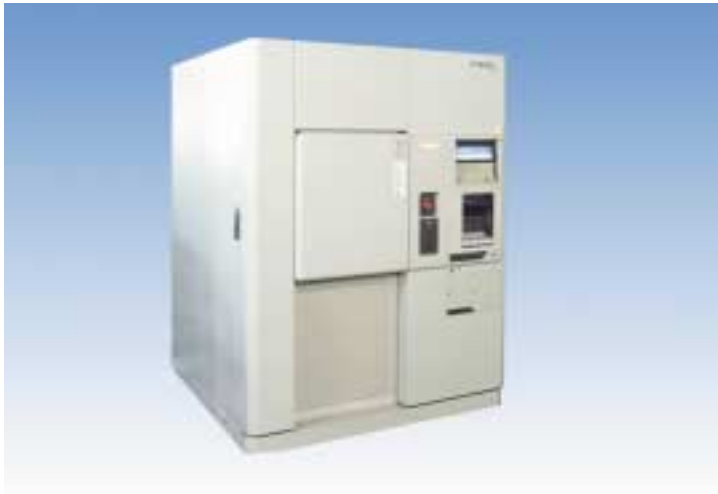
冷熱衝撃装置 TSA-70S (タバイエスペック製)