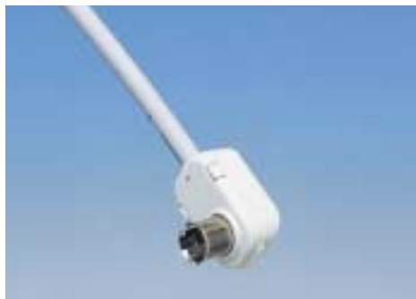
L型ワンタッチコネクタ