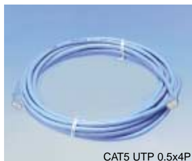
CAT5 UTP 0.5x4P