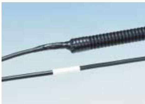
PVCテープ、コルゲートチューブ 取付ハ - ネス